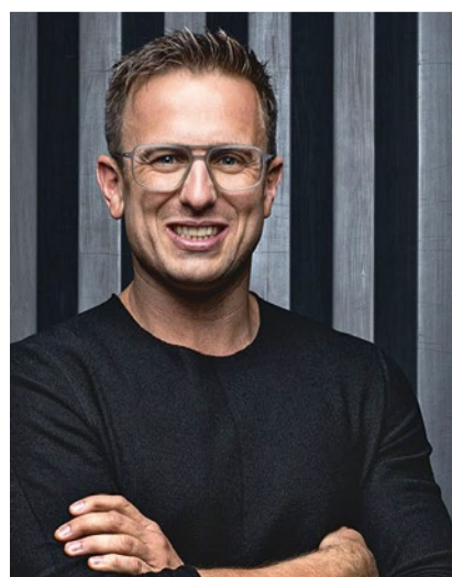
Simon Brunner Denkinger Spedition