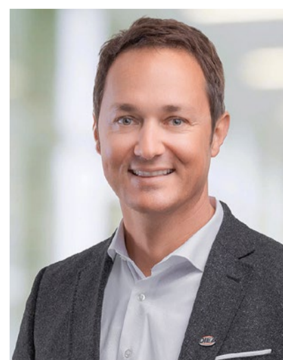
Andreas Diez Diez Spedition