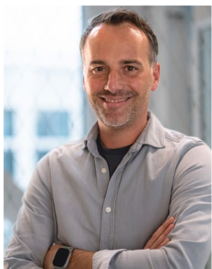
Christian Wilz Mercedes-Benz Trucks