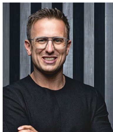
Simon Brunner Denkinger Spedition