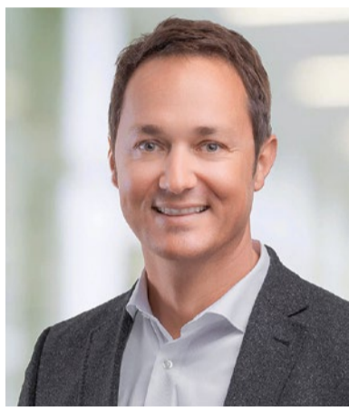
Andreas Diez Spedition Diez