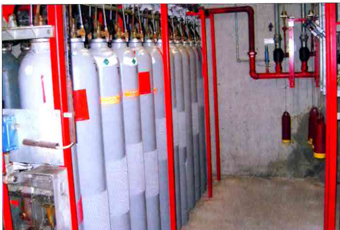
Die kleineren Lagerabschnitte von VS Logistics in Würzburg werden über eine angebundene Kohlendioxid-Flaschenanlage geschützt.

In der Praxis machen Lösversuche letztlich auch wenig Sinn. Die Feuerwehr kann sich hier nicht mal auf ein kontrolliertes Abbrennen – wie sonst oft bei Gefahrgutbränden – konzentrieren, sondern letztlich nur das Weite suchen. Die Einhaltung von Sicherheitsabständen und Nettoexplosivstoffgrenzen sowie Explosionsschutz- und Evakuierungsregelungen stehen hier im Vordergrund des Brandschutzes. Traditionell finden sich Lager für Klasse 1 in alten Militäranlagen bzw. Bunkern, die nach außen sehr gedämmt sind, aber auch über Ausblasewände verfügen. Diese lenken eine Explosion in die „gewünschte“ Richtung. ■